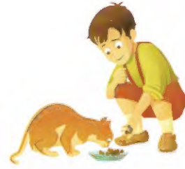
أَطْعَمَ / يُطْعِمُ